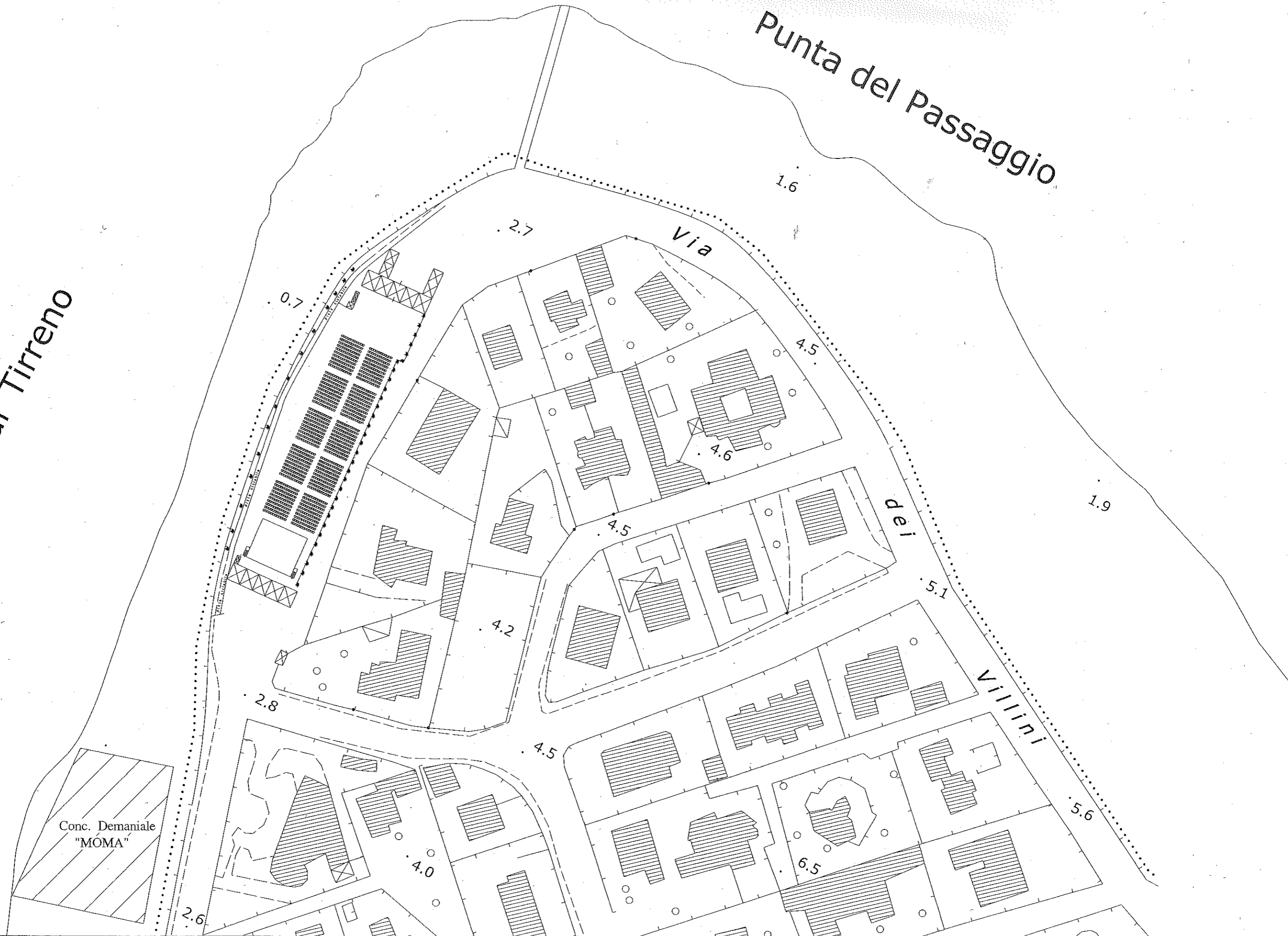
PLANIMETRIA DI PROGETTO - IDENTIFICAZIONE DEI CONFINI DEMANIALI Scala 1/1.000